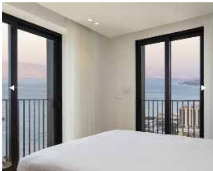
סוויטה JUNIOR CORNER