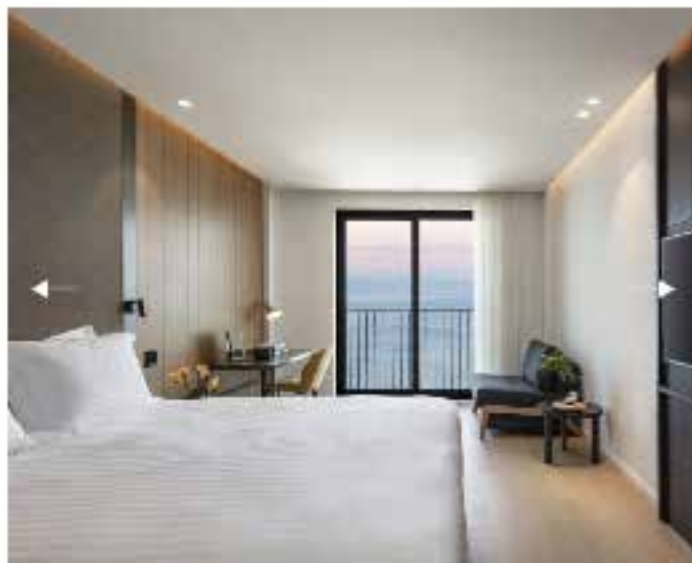
חדר PREMIUM LAKE VIEW